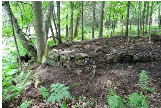
Deux vues du site avant les fouilles

À l'automne 2017 j'avais du temps libre et j'ai commencé à observer le site plus en détail : les quelques murs de pierre que j'avais observés se sont révélés être beaucoup plus imposants que je ne l'avais imaginé. C'est en regardant les photos de l'autre moulin que j'ai réalisé que je devais chercher depuis le pied de la chute sous le pont jusqu'à très loin en aval tout le long de mon terrain jusqu'à chez mon voisin.