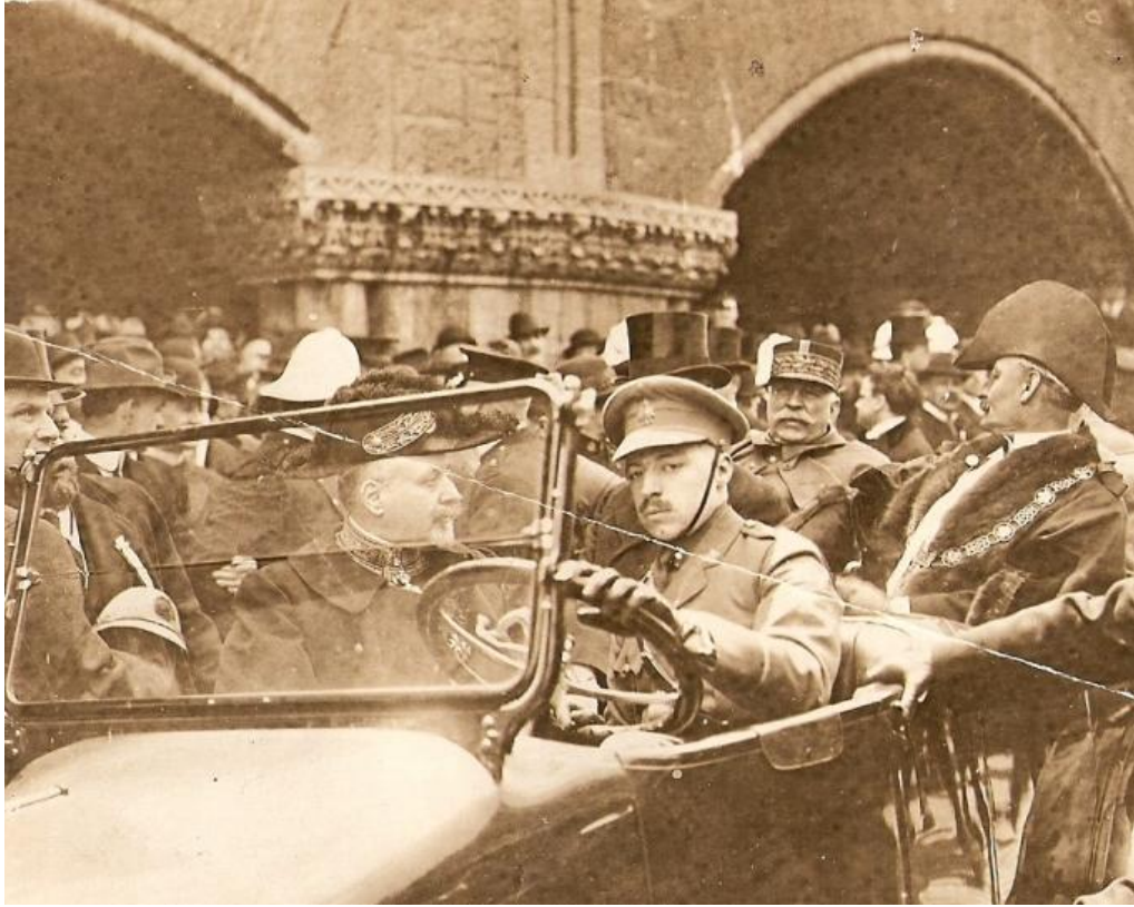
Visite du Maréchal Joffre en mai 1917