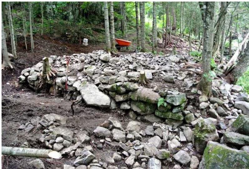
Le deuxième bâtiment

Donc il y avait un premier réservoir au pied de la chute, on voit encore très bien jusqu'où le niveau de l'eau était amené par la trace de l'érosion le long de la rive. À la hauteur du premier barrage on trouve un premier mur de pierre ancien parfaitement conservé qui semble être un réservoir. Après ce mur j'ai dégagé peu à peu la terre qui s'est accumulée avec les années et je constate que toute la rive a été pavée et aménagée pour former un chenal conduisant à un deuxième bâtiment, un rectangle de pierre qui devait servir de fondation à un des moulins.