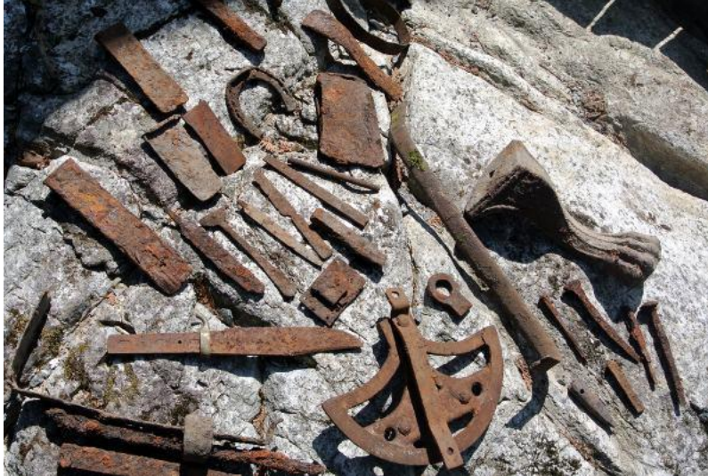
Objets trouvés

En dégageant la terre j'ai trouvé de nombreux objets en métal : fers de hache, limes, clous, couteau, coins, fer à cheval, pesée, fil à plomb, pied de poêle, barrures et pentures, etc.