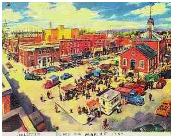
Le marché Bonsecours