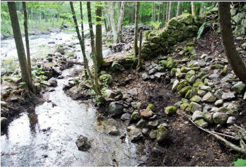
Le premier mur

Donc il y avait un premier réservoir au pied de la chute, on voit encore très bien jusqu'où le niveau de l'eau était amené par la trace de l'érosion le long de la rive. À la hauteur du premier barrage on trouve un premier mur de pierre ancien parfaitement conservé qui semble être un réservoir. Après ce mur j'ai dégagé peu à peu la terre qui s'est accumulée avec les années et je constate que toute la rive a été pavée et aménagée pour former un chenal conduisant à un deuxième bâtiment, un rectangle de pierre qui devait servir de fondation à un des moulins.