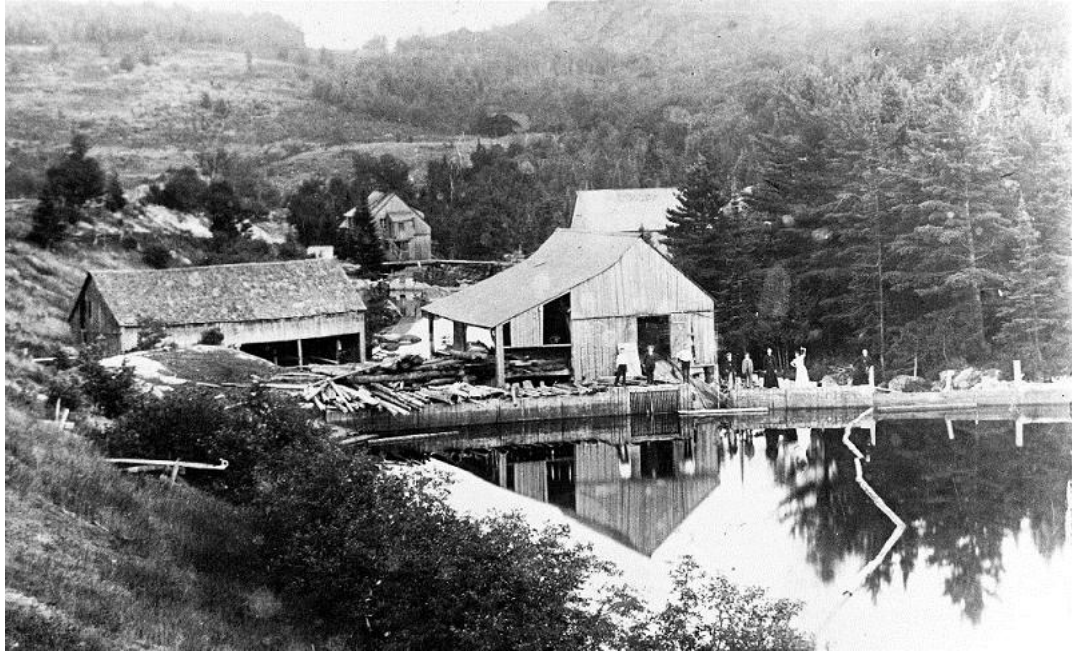
Le moulin double de la rivière Burton : un modèle type