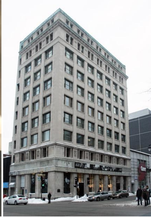
U.H. Dandurand en 1915