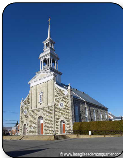
Église de Sainte-Mélanie

Les héritières ne conservèrent que le droit de rentes seigneuriales auprès des personnes qui n'avaient pas racheté leurs terres au lendemain de l'abolition du régime seigneurial en 1854. Chaque année, elles percevaient ladite rente, le 2 novembre, après la messe de requiem. En 1940, la municipalité remplaça les héritières en tant que créanciers et incorporèrent la dette au compte de taxes municipales. Elles prirent fin au début de 1970.