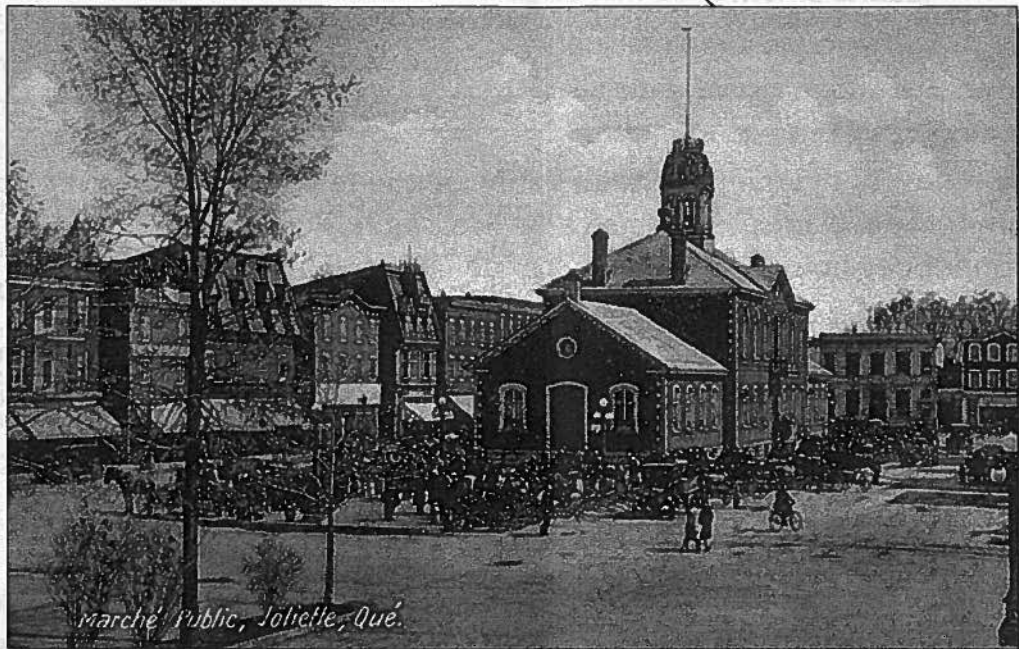
Marché Public, Joliette, Qué.

Bulletin de la Société d'histoire de Joliette - De Lanaudière